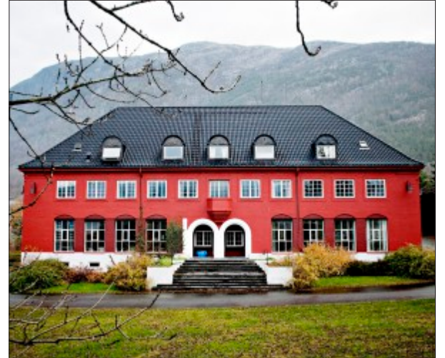
SENTRAL I ÅLVIK: Messen er teikna av Ålvik-arkitekten Nicolai Beer og stod ferdig i 1925.

Messen, som tidlegare var kontorbygning for Bjølvefossen i Ålvik, skal seljast. Det betyr at Ålvik-kunstnarane går ei usikker framtid i møte.