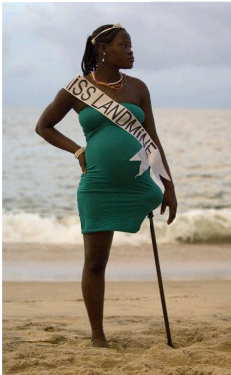
OFRE ELLER OVERLEVERE? «Miss Landmine» i Angola (det store bildet) har vakt oppsikt internasjonalt. Men Kulturrådet vil ikke fortsette å støtte prosjektet, til tross for scenekunstutvalgets innstilling.